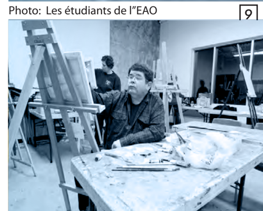
Photo: Les étudiants et instructeurs de l'EAO