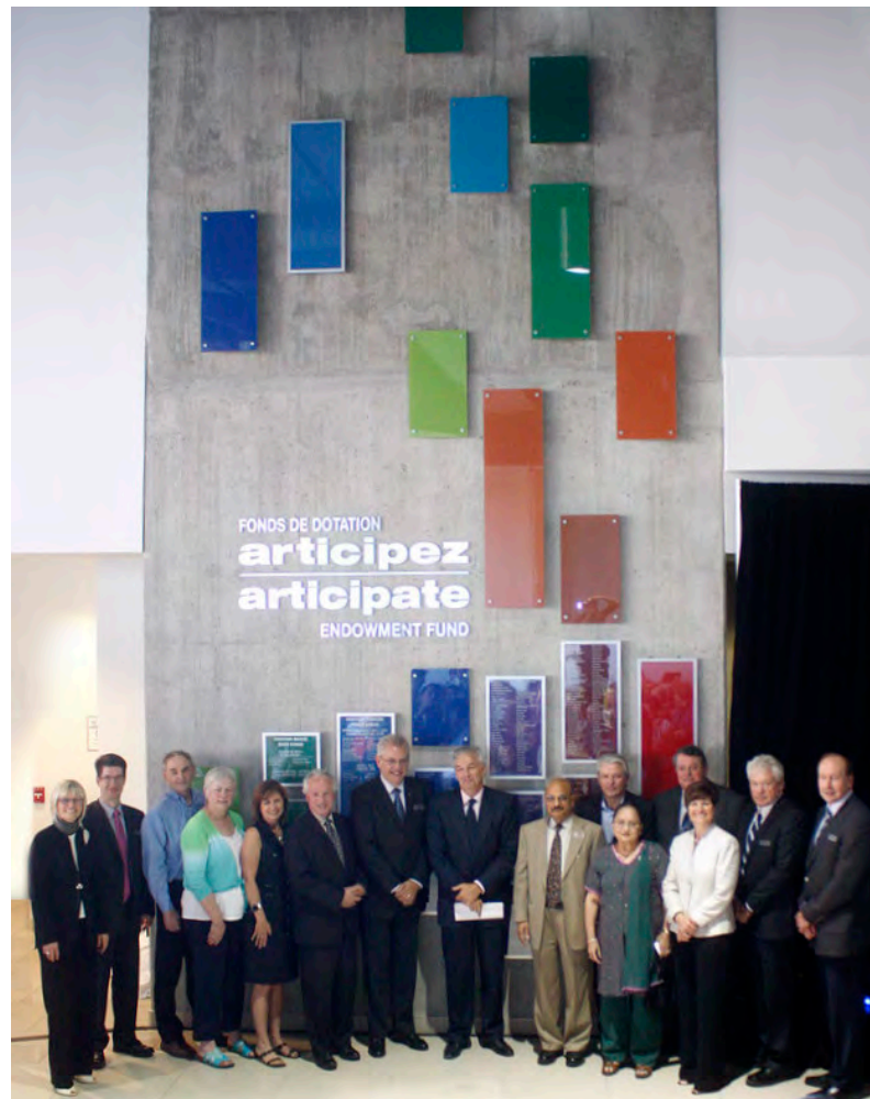
Les donateurs majeurs devant le Mur des Donateurs, lors de son dévoilement, du 19 mai 2010.