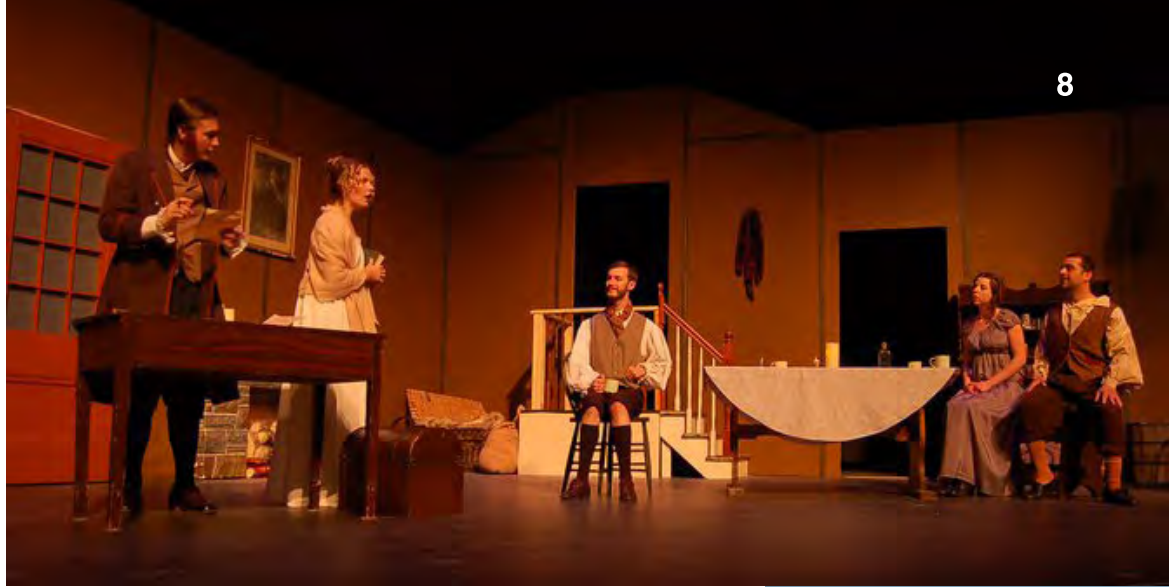
Une scène de la pièce A Dickens of a Christmas de Vintage Stock Theatre au Théâtre Richcraft

Gharana Arts , pour sa production d'Ekalavya, un récit mythique qui traite de la dévotion, de l'amour et du sacrifice d'un guerrier. Pour l'équipe de Gharana Arts, cette histoire est une métaphore qui illustre les difficultés que doivent surmonter plusieurs artistes multiculturels qui pratiquent un art traditionnel en Amérique du Nord, loin de leurs maîtres et de leur culture. La subvention a servi à améliorer la production et à la production et à inviter des danseurs reconnues à se joindre au spectacle.